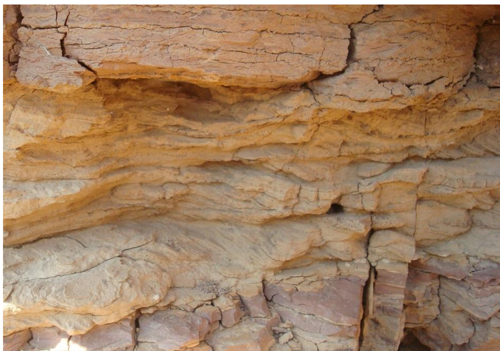
Четко выраженное разнонаправленное залегание аллювия.