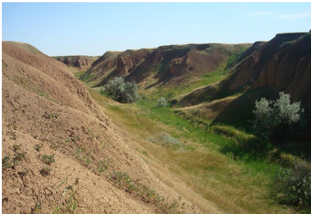
Основная часть дна балки у входа.